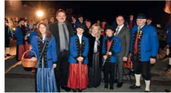
Empfang der Gäste mit der Musikkapelle Paudorf