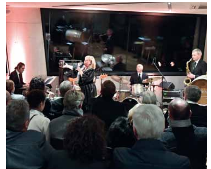
Gesangseinlage von Frau Prof. Marianne Mendt