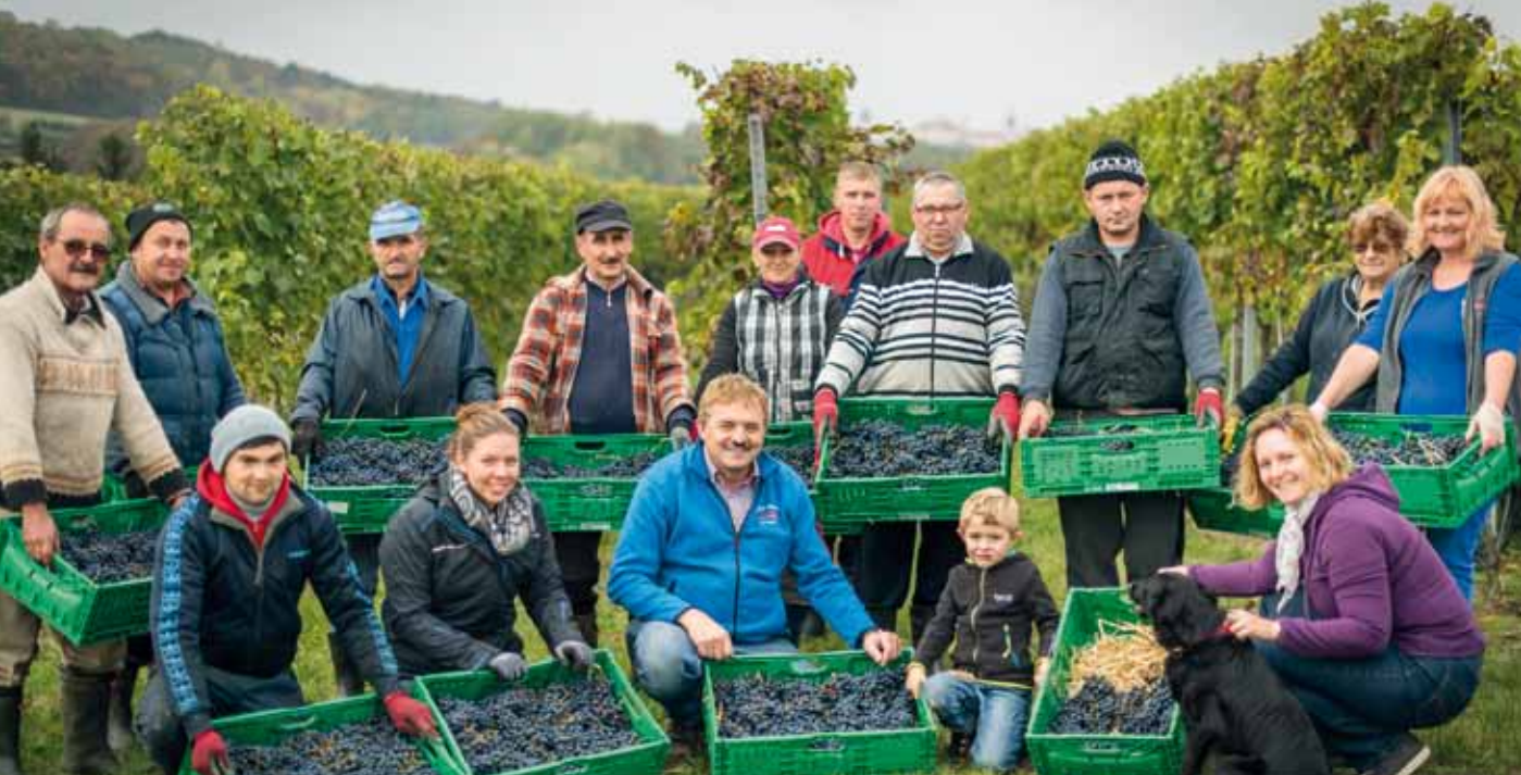
Strohweinlese mit der Rebsorte Cabernet Sauvignon 2016