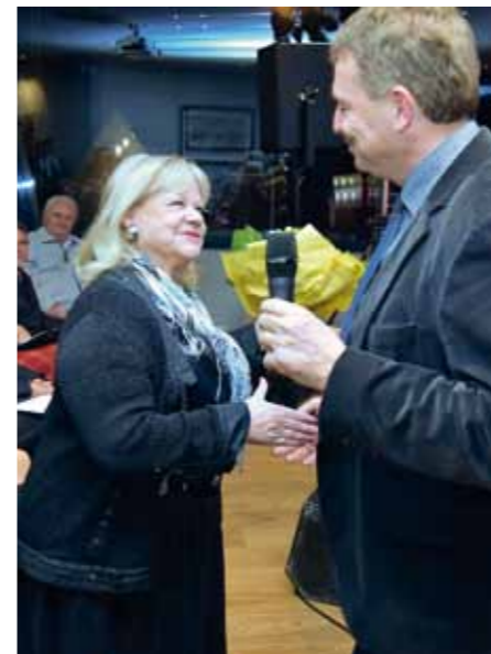
Begrüßung der Weintaufpatin durch den Hausherrn