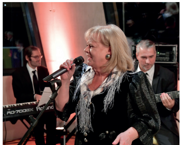
Marianne Mendt und ihre Musiker