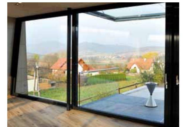
Terrasse mit Blick auf Göttweig