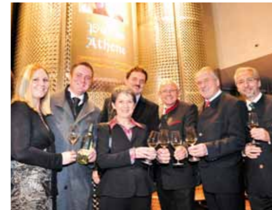
Familie Dockner mit Ehrengästen