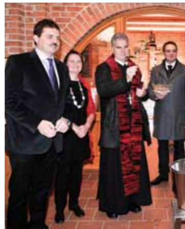
Segnung der Schaubrennerei