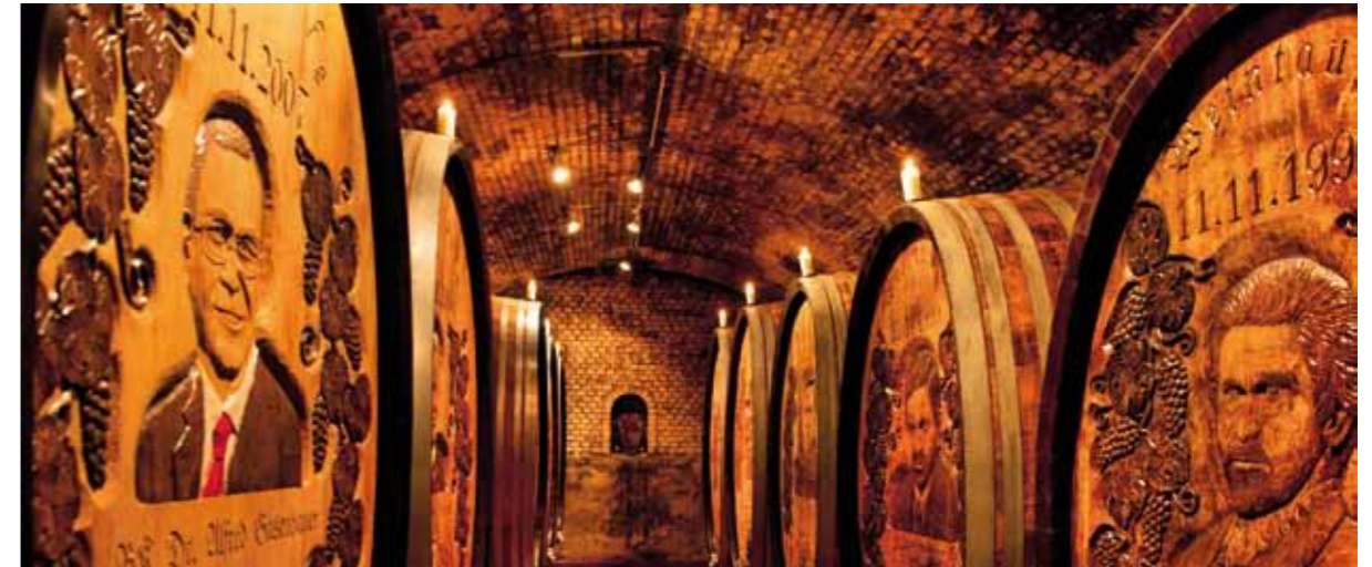
Fixer Bestandteil der Tour: unser Holzfasskeller