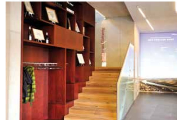
Der Stiegen spindlekasten zum wein.genuss Göttweig