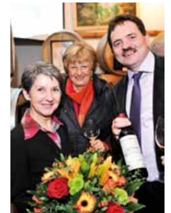
Blumen für die Taufpatin