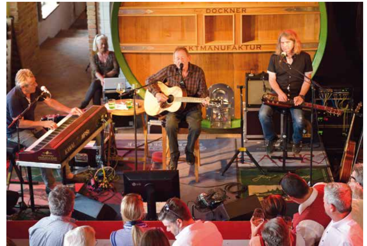
Die Besetzung von Ambros Pur