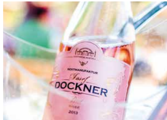
Dockner Brut Rosé

Eintritt: 30 Euro/ Person Beim Kauf von 6 Flaschen Dockner Brut Rosé wird der Eintrittspreis rückerstattet.