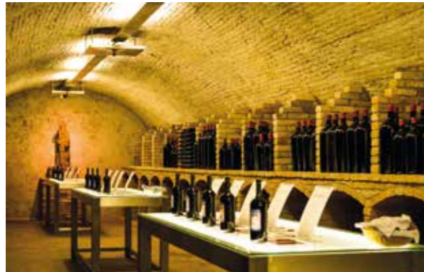
Die Sacra-Vinothek mit allen Sacra-Jahrgängen