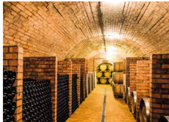
Lagerkeller in der Sektmanufaktur