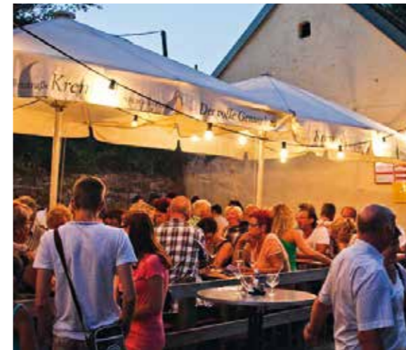
Gemütliche Stimmung am Höbenbacher Kellergassenfest

Wie jedes Jahr findet auch heuer wieder am letzten Juli-Wochenende unser berühmtes Höbenbacher Kellergassenfest statt. Genießen Sie diese einzigartige Kellergasse bei einem schönen Glas Wein und einer gemütlichen Heurigenjause. Die Höbenbacher Kellergasse zählt laut Kellergassenführer zu den schönsten Österreichs. Die Kellerbesitzer sind Jahr für Jahr bemüht, dieses Fest zu einem besonderen Highlight im Veranstaltungskalender zu machen.