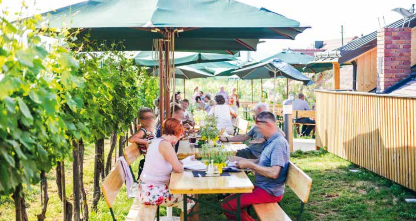
Die gemütliche Terrasse mitten in den Weingärten am Kremser Frauengrund