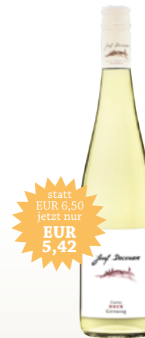
Cuvée Dock Göttweig 2017

Eine junge, frisch-fruchtige Weißwein-Cuvée, bestehend aus den wichtigsten Sorten der Großlage Göttweiger Berg. Die Hauptsorte, der Grüne Veltliner, ist maßgeblich beteiligt. Ein Touch Riesling sowie Gelber Muskateller verleihen diesem Wein seine besonders fruchtige Aromatik. Ein perfekter Begleiter für gesellige Stunden. 12,0% vol · trocken