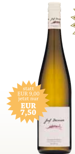
Sauvignon Blanc Göttweiger Berg 2017

Ein sehr eleganter und typischer Gelber Muskateller aus der Großlage Göttweiger Berg. In der Nase intensive Duftnoten nach frischen Muskateller-Trauben. Am Gaumen saftige Primärfrucht mit harmonischem Säure- Fruchtzucker Spiel. Ein lebendiger und angenehmer Aperitif- und Terrassenwein, mit trinkanimierendem Stil. 12,0% vol · trocken