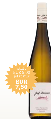
Gelber Muskateller Göttweiger Berg 2017

Eine junge, frisch-fruchtige Weißwein-Cuvée, bestehend aus den wichtigsten Sorten der Großlage Göttweiger Berg. Die Hauptsorte, der Grüne Veltliner, ist maßgeblich beteiligt. Ein Touch Riesling sowie Gelber Muskateller verleihen diesem Wein seine besonders fruchtige Aromatik. Ein perfekter Begleiter für gesellige Stunden. 12,0% vol · trocken