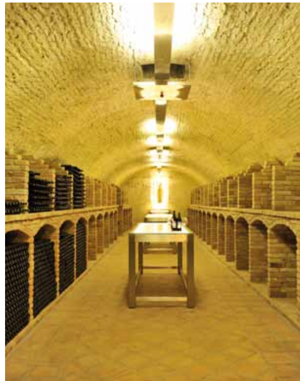
Sacravinothek geöffnet am 30. 5. 2013 von 11.00 - 18.00 Uhr

MONTAG - SAMSTAG 8.00 Uhr - 12.00 Uhr, 13.00 Uhr - 18.00 Uhr