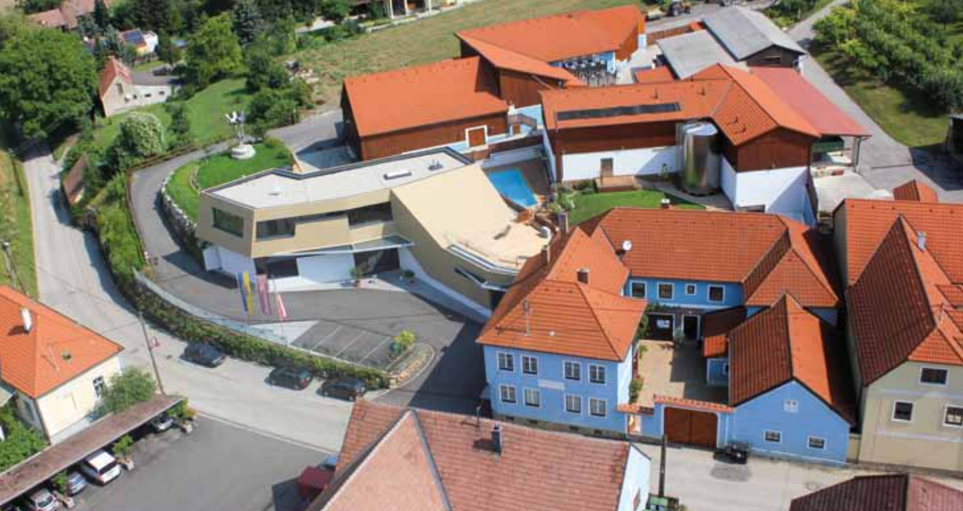
Unser Weinverkostungszentrum mit Kellerei und Stammhaus