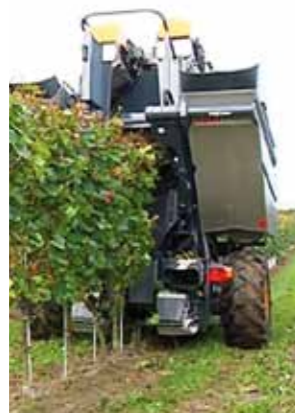
Unsere neue computergesteuerte Lesemaschine