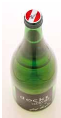
Rot/weiß/rot Banderole ist österr. Qualitätswein

Durch die kleine Ernte sind wir mit dem neuen Jahrgang 2010 gezwungen, eine Preiserhöhung von ca. 10 % bei unseren Flaschenweinen 0,75 lt durchzuführen. Die Preise für unseren 1 lt Grüner Veltliner u. 1 lt Zweigelt haben wir bereits am 1. November um 15 % erhöht. Beide Weine kosten ab sofort Euro 3,50 für unsere Privatkunden ab Hof. Das ergibt eine Preiserhöhung von ca. 15 % die wir auch durch die Umstellung vom Landwein auf österr. Qualitätswein rechtfertigen. Nicht nur die kleine Erntemenge sondern ab sofort die kontrollierte höhere Qualität mit staatl. Prüfnummer ergeben diese Preiserhöhung.