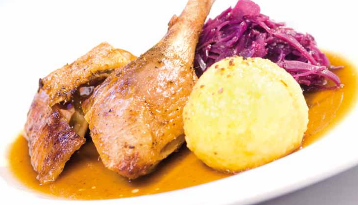
Martini Gansl mit Rotkraut und Kartoffelknödel