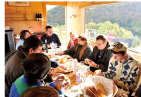
Jause in unserer Weingartenhütte