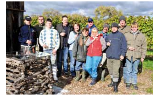
Unser Weingarten-Team bei der Handlese