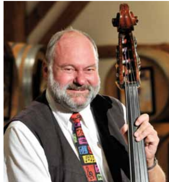
Prof. Wolfgang Friedrich

Auch unser Weihnachtsmarkt findet wieder am 1. Wochenende im Dezember (4.12. und 5.12.) statt. Besuchen Sie unseren Weihnachtsmarkt, wo wir Ihnen auch schöne Weihnachtsgeschenke präsentieren und wo Sie die Möglichkeit haben, alle Weine im Keller zu verkosten.