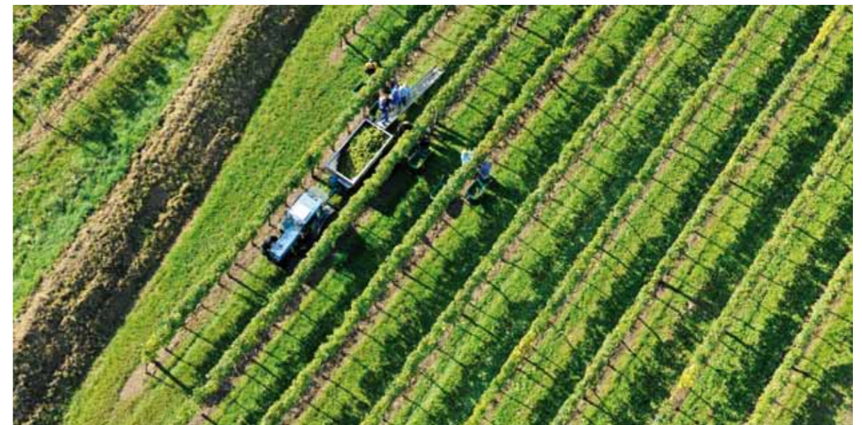
Die Handlese auf unserer Toplage Furthner Oberfeld