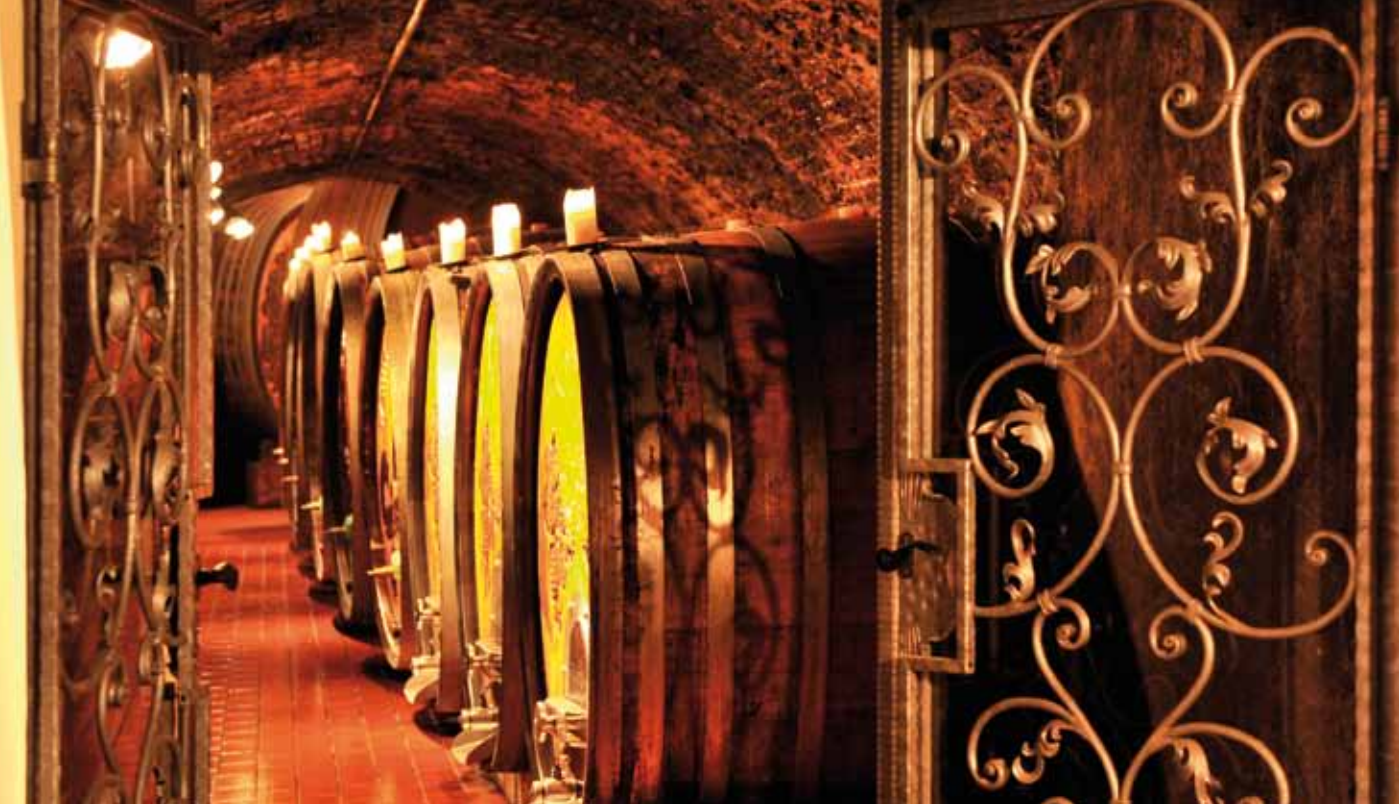
Tag der offenen Kellertüre