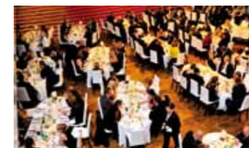
Festsaal im Platinum Vienna