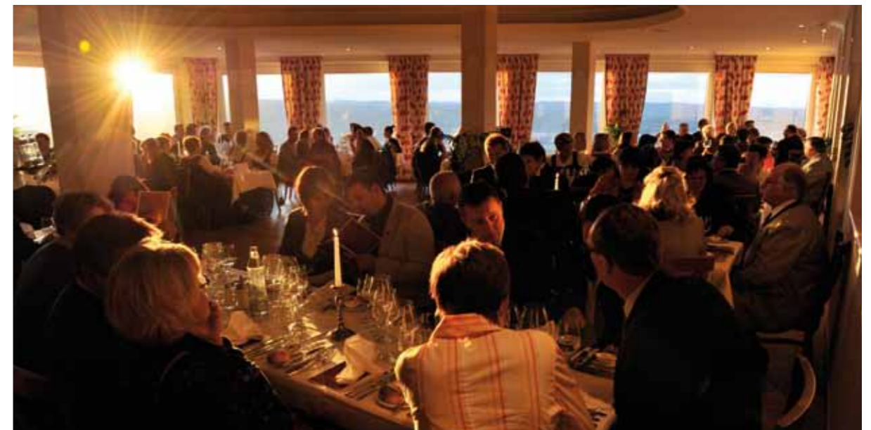
Gala-Dinner mit SACRA Verkostung im Stiftsrestaurant Göttweig