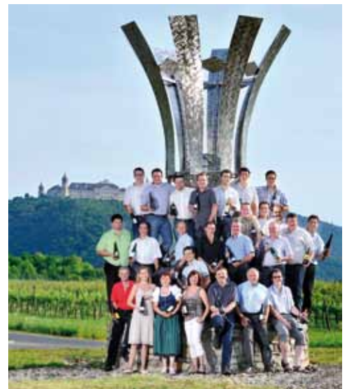
25 Jahre Vinum Circa Montem

Mehr Informationen: www.vinumcircamontem.at