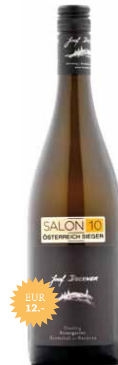
Riesling Rosengarten Kremstal DAC Reserve

Die Top-Traubenselektion aus unserer besten Veltlinerlage, dem Hollenburger Lusthausberg. In der Nase reife, gelbe Frucht, sehr intensiv, unterlegt mit eleganter, feiner Kräuterwürze; zarte Honiganklänge. Am Gaumen kraftvoll und körperreich mit feinem extrasüßem Schmelz und zarten tabakig-mineralischen Noten. Sehr kraftvolles Finish, bleibt sehr lange haften und hat bereits jetzt eine schöne Harmonie. ein Wein für die nächsten Jahrzehnte.