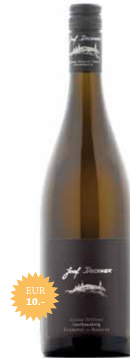
Grüner Veltliner Lusthausberg Kremstal DAC Reserve

Dieser Wein stammt von unserer besten Veltlinerlage, dem Hollenburger Lusthausberg. In der Nase sehr intensiv und vielschichtig; feine Kräuterwürze, ein Hauch von Dörrobst, zarte Honiganklänge und eleganten tabakig-rauchigen Nuancen. Am Gaumen stoffig, füllig und komplex, dunkle Frucht, opulent mit sehr kraftvollem Finish. Ein absoluter Top-Veltliner mit viel Potenzial.