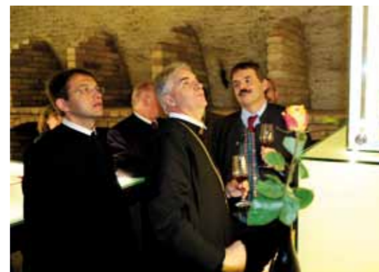
Vor der Statue des Heiligen Urban