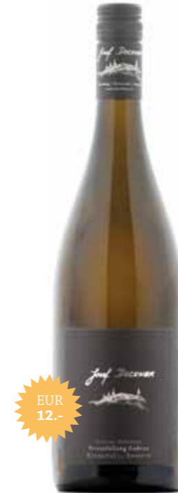
Grüner Veltliner Privatfüllung Gudrun Kremstal DAC Reserve

Dieser Wein stammt von unserer besten Veltlinerlage, dem Hollenburger Lusthausberg. In der Nase sehr intensiv und vielschichtig; feine Kräuterwürze, ein Hauch von Dörrobst, zarte Honiganklänge und eleganten tabakig-rauchigen Nuancen. Am Gaumen stoffig, füllig und komplex, dunkle Frucht, opulent mit sehr kraftvollem Finish. Ein absoluter Top-Veltliner mit viel Potenzial.