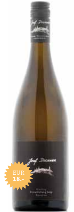
Riesling Privatfüllung Sepp Reserve

Ein Prachtexemplar eines Rieslings, von unserer besten Rieslinglage, dem Rosengarten. Schöne, elegante Steinobstnase und süße Pfirsichfrucht unterlegt mit einem zarten Honigtouch und etwas mineralischer Würze. Am Gaumen kraftvoll, saftig, elegante Frucht, mit feinen exotischen Anklängen. Sehr gut integrierte Säurestruktur, und dadurch schöner trinkanimierender Stil. Sehr gut integrierte Säurestruktur, dadurch schöner trinkanimierender Stil. Österreich-Sieger beim SALON, dem härtesten Wettbewerb Österreichs.