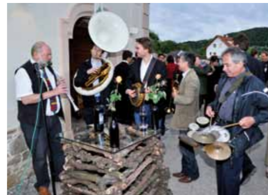
Die New Orleans Dixieland Band