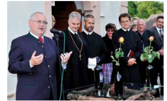
Präsident Franz Backknecht