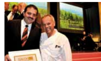
Sepp Dockner mit Starkoch Wolfgang Puck